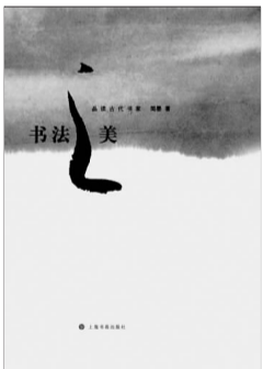
《书法之美》 简墨 著 上海书画出版社

翻开《书法之美》,作者简墨,一个年轻女子,一个自由撰稿人。看下去。只读了几页,眼前一亮,神清气爽,仿佛置身空谷,俯临曲水,一片幽兰修竹。我暗自惊叹:济南居然还雪藏着一个文质清丽、情若春山的才女啊!