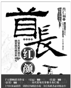
《首长红颜》 肖仁福 著 华文出版社

所谓历史,尤其是中国的古代史,不过是套在形形色色的臭脚上的袜子罢了。但写史的人偏要装模作样,给破洞百出的臭袜子涂脂抹粉,企图使它香飘千载。