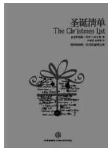
中信出版社 《美》理查德·保罗·伊万斯 著 《圣诞清单》

一个可笑的误会,让房地产大亨詹姆斯“死而复生”。他甜蜜的情人、恭顺的属下在他的“死讯”面前原形毕露。而这次意外的洗礼,也让詹姆斯如遭当头棒喝。做了那么多年风生水起的大富豪,他真的只落下冷酷无情、抛妻弃子的恶名?