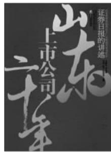
企业管理出版社 司涛 赵宁 赵彬彬 主编 《山东上市公司二十年》

在中国证券市场成立二十周年之际,由《证券日报》山东记者站组织编写的《山东上市公司二十年:证券日报的讲述》一书近日出版。该书从媒体、企业和政府等不同视角对山东证券市场二十年的发展历程进行深度回顾、总结、思考,从不同侧面展示了一批山东上市公司改革、发展、创业的奋斗历程和辉煌业绩,为加快推动山东资本市场健康稳定发展提供了十分有益的参照和启示。