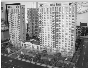
华府天地还剩10余套房源。