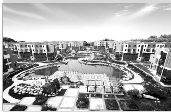
奥林匹克花园日渐成熟。