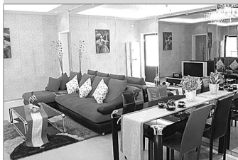
安居·上上城靓丽样板间。

据了解,丰富的地貌文化是龙泉花苑——龙湾别墅的最大特点,以周边原生态为主体,与区内人造景观相结合,两者交相辉映,突出了项目“观山、观水、观天下”的完美主题,中心景观设计引进了苏、杭园林,融合了泰山山水文化,集自然生态于一体,是国内一流的山水园林情景式花园别墅。贵宾热线:0538—8560999