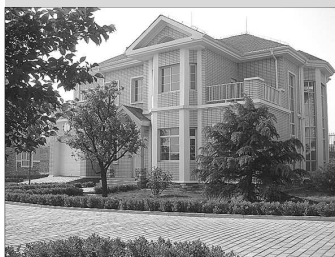
龙泉花苑,一流的山水园林情景式花园别墅。