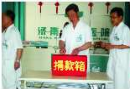
医院定期举办“慈心一日捐”活动