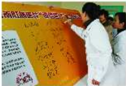
济南肛肠医院3.15“诚信医疗”签字宣誓