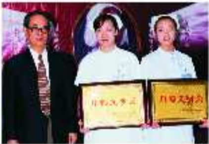
获得“巾帼文明岗”荣誉称号