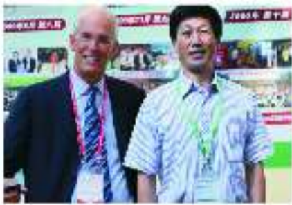
王院长参加上海国际肛肠年会时与美国专家合影