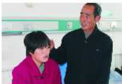
“智障女孩”小英在爱心手术室援助下康复