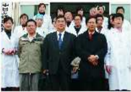
台湾专家团与济南肛肠医院专家技术交流