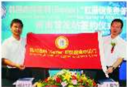
与“世界五百强企业”森特集团强强联合