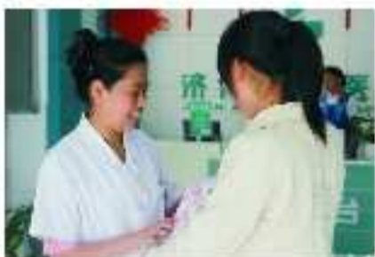
爱心手术室援助“无肛宝宝”引起广泛关注