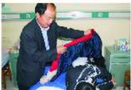
一罕见肛肠疾病小患者获得爱心手术室援助