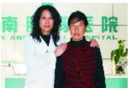
爱心手术室援助患者愈后与主治医生合影