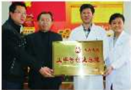
济南总工会授予“4A工字号创业基地”