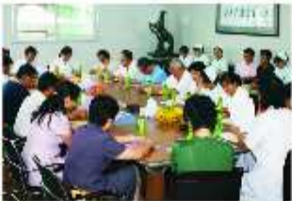
与国内肛肠诊疗名家就无痛手术进行研讨