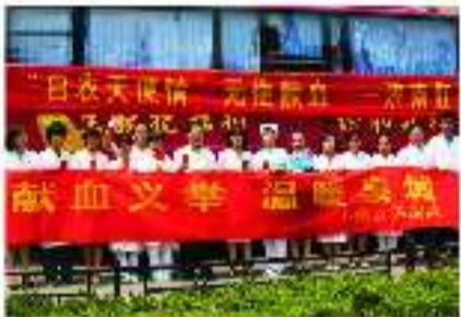
得知泉城“血荒”,医护人员积极献血