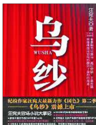
2010年走红的几部官场小说