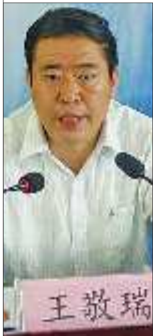
山西阳泉市副市长王敬瑞