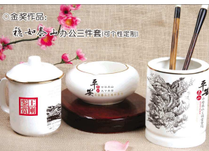
金奖作品：泰山姓氏文化礼品系列(定制)