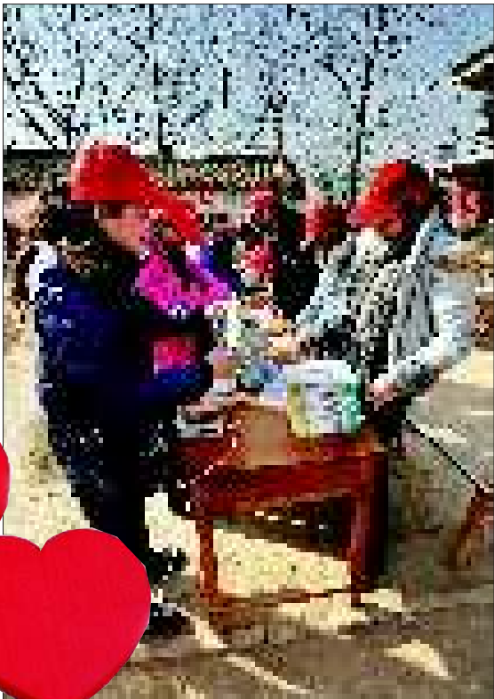
►渭南志愿者正在整理捐助书籍 这些书籍被放进了思语爱心书屋(资料图)