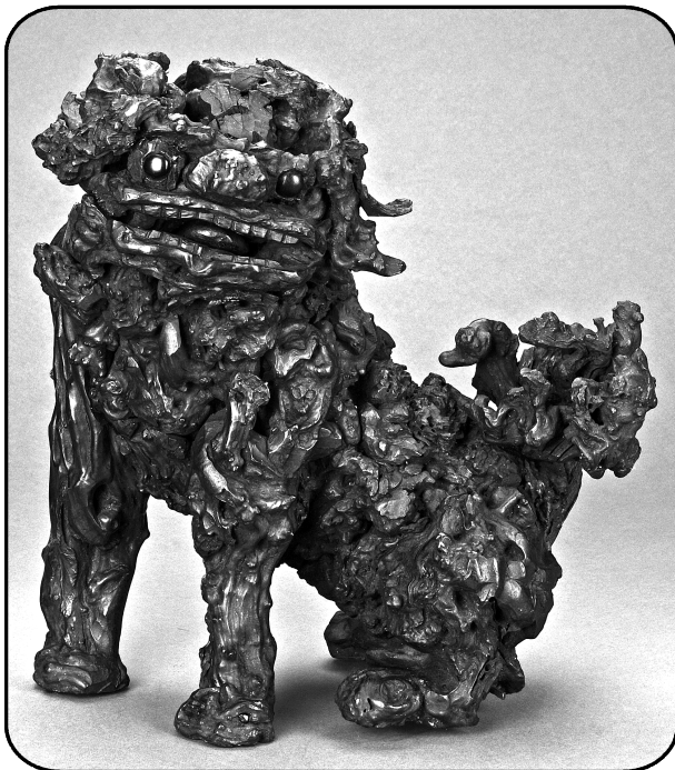
清乾隆沉香狮子。