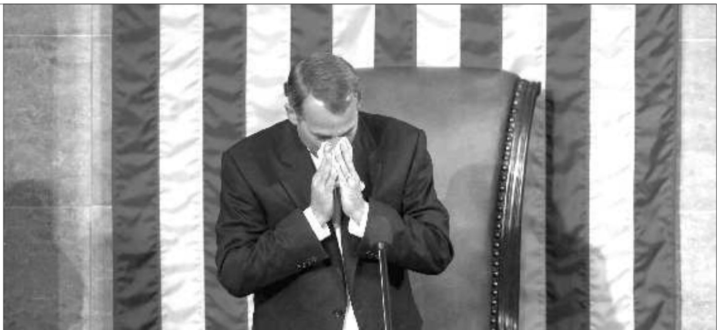
▲博纳在就职议长时泪流满面。