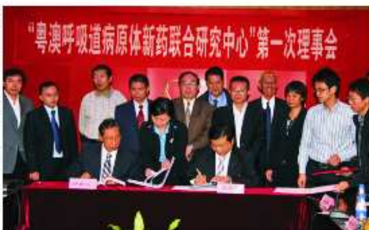
“粤澳呼吸道病原体新药联合研究中心”第一次理事会

●2009年10月,白云山板蓝根获得国家食品药品监督管理局批准,成为首个通过GAP认证的板蓝根产品。