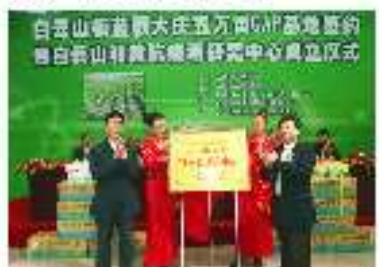
白云山和黄抗病毒研究中心成立

白云山和黄联手打造最大抗病毒中药供应基地,白云山和黄联手打造最大抗病毒中药供应基地,白云山和黄联手打造最大抗病毒中药供应基地。