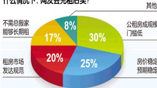
人民日报关于买房问题的调查数据。