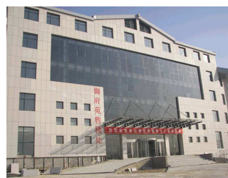
泰山御府苑售楼处所在的小区综合楼。

据了解,泰山御府苑项目是由泰安市时代房地产开发有限公司开发建设的,占地面积12万平方米,建筑面积17万平方米,总户数1425户,是由53幢多层住宅、高层住宅和别墅组成的大型居住区。