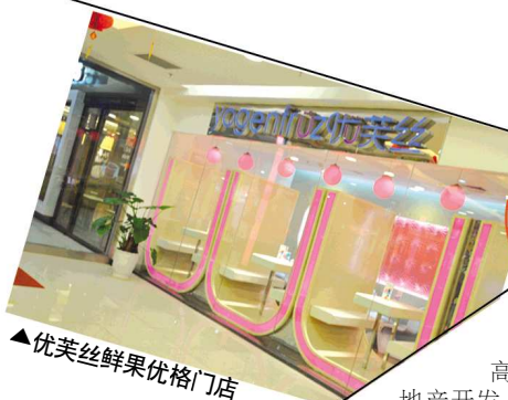
▲优芙丝鲜果优格门店

高新开发区商业地产开发、市政设施配套日臻完善,已渐渐成为济南新地标东移的抢手片区。餐饮酒店、休闲娱乐等店也是扎堆开业,自香港街、姚家镇起渐渐向东持续渗透。在工业南路和开拓路的东南角,“理想新城群英会”一处沿街三层商业房,金汉森德啤酒世家新店将于今年四月份开业,一层是自酿啤酒接待区和儿童娱乐区;二层是开放式厨房及大型自助餐、烤肉及特色菜品。