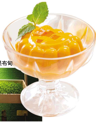
▶太兴茶餐厅芒果布甸

YOGO JUICE:令每一位顾客都感受到100%水果魔力,用新鲜果饮带给你快乐心情和充沛活力。优果选用纯天然水果和100%纯鲜果汁为原料,每一款果饮都蕴含了3至5种水果的复合营养,低脂肪、高纤维、低热量,给大家带来纯正天然的健康能量!