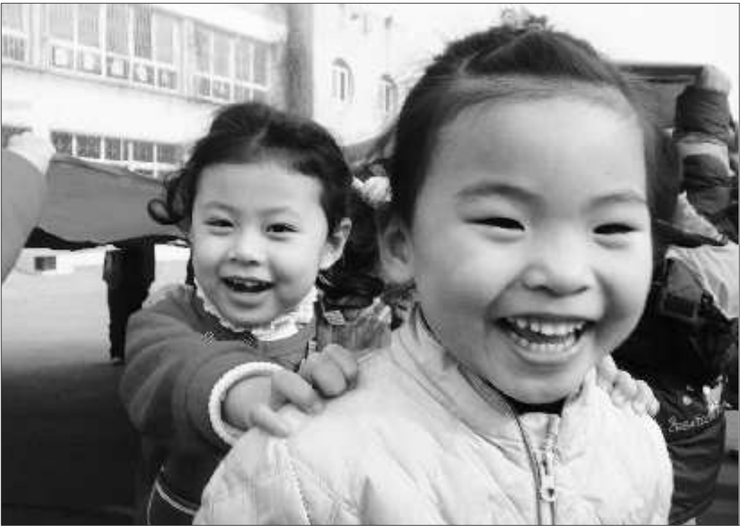
19日,实验幼儿园的小朋友们正在开心地玩游戏。