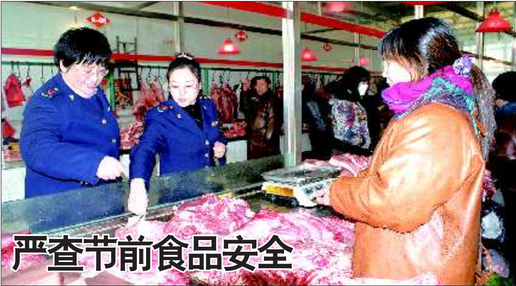
严查节前食品安全

日至 18 日,办理《烟花爆竹经营(零售)许可证》。 据东城工商所的工作人员介绍,所有烟花爆竹批发企业和经营业户必须到安监部门办理《烟花爆竹经营(零售)许可证》,之后,经营户持个人身份证和《烟花爆竹经营(零售)许可证》到工商部门办理《临时营业执照》。一位工作人员说:“烟花爆竹批发企业如果没有《许可证》,就不得向消费者直接销售,各零售摊位准备工作完成前,批发企业也不得供货。” 按照规定,在每个临时销售摊位确定经培训合格的 3 名销售人员;销售点由安监部门统一规划,并远离加油站等危险场所 100 米以上,距学校、医院等公共聚集场所 50 米以上;摊位之间间距不得少于 50 米,每一摊位配备灭火器材须用帆布全封闭,并留有 1 米以上的安全出口,棚外不得摆放烟花爆竹;严禁将烟花爆竹储存居户内,不得销售按照国家规定应由专业燃放人员燃放的烟花爆竹,零售业户严禁从事批发性经营等。