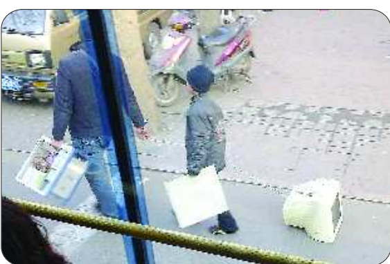
▲“拖”机操作 时间:2011年1月24日 地点:山大路 器材:诺基亚C6-00 自述:废旧电脑拖着走。 点评:喜新厌旧。(拍客奖50元)