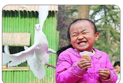
元玉泉:灿烂笑容,瞬间定“鸽”。 spoilpig:“鸽鸽”喜欢追美眉!

招聘订版电话: 0531-67886618/28/38 地址: 经七纬五 75号(泉景恒基大厦)