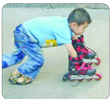
▲鞋手同行 时间:2010年6月5日 器材:松下FX01 自述:轮滑鞋套在手上,另有一番乐趣。 点评:动手能力很强。(拍客奖50元)