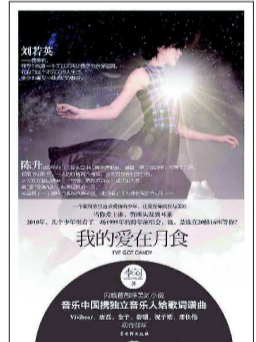
◆书名:我的爱在月食 ◆作者:李倩 ◆出版社:古吴轩出版社

风平静吹起 像游在海底 神奇的温度蠢蠢欲动 恰好似失忆 又连沙吹起 青涩的潮汐——涌现 你像一个耍赖不乖的死亡小孩 跳了海就不想游上来 只想被人抱起来 你像一片众人举目的夜星辰 孤独了还闪耀着泪痕 大家还以为你快乐 树上的石榴又腐化了 这天气太容易让人想起