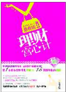
◆书名:《理财富心计》 这样做女人最有钱2 ◆作者:高洋 ◆出版社:金城出版社

另一方面,安妮挂掉电话后,也沉浸在一种莫名的情绪之中,可能有些许伤感,窃喜或者别的什么,她自己也想不清楚,但应该是个不错的结果;但随即,她又陷入了另一阵思考之中,艾凌主动与自己联系了,很明显是渴望与自己重新开始差点丢掉的友情,那么,她与连辛呢?安妮想着,其实她在心里早就原谅连辛了,也对吴凯所做事情释怀了。毕竟,商场如战场,自己不过是其中的一名士兵,听从“安排”,身不由己,这都没有什么可抱怨的,更何况事情发生后不久,连辛还多次发消息来道歉,只不过那个时候,执拗的安妮没有给连辛任何解释的机会。