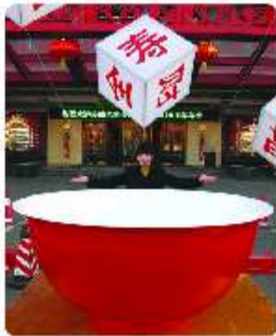
济南舜和国际酒店直径两米的大碗