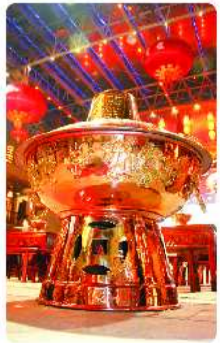
青岛劈柴院“最大火锅”高1.5米