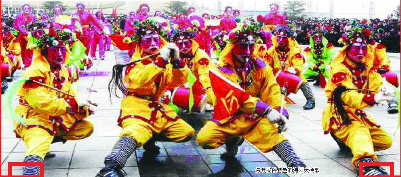
最具民俗特色的海阳大秧歌