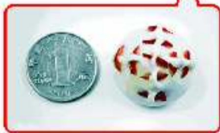
烟台“最小枣饽饽”一个仅7克重,699个拼出“福禄寿喜财 五福齐临门”字样