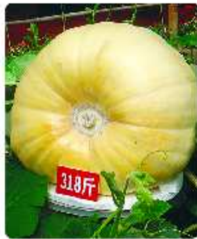
兖州农高园的巨型南瓜

为了增加大众参与的趣味性、挑战性,2011年好客山东贺年会继续推出“贺年会之最”评选活动。最大、最长、最高、最MINI……凡是可以以数字和标准来衡量的空间、体积类项目,都能来参评“贺年会之最”。