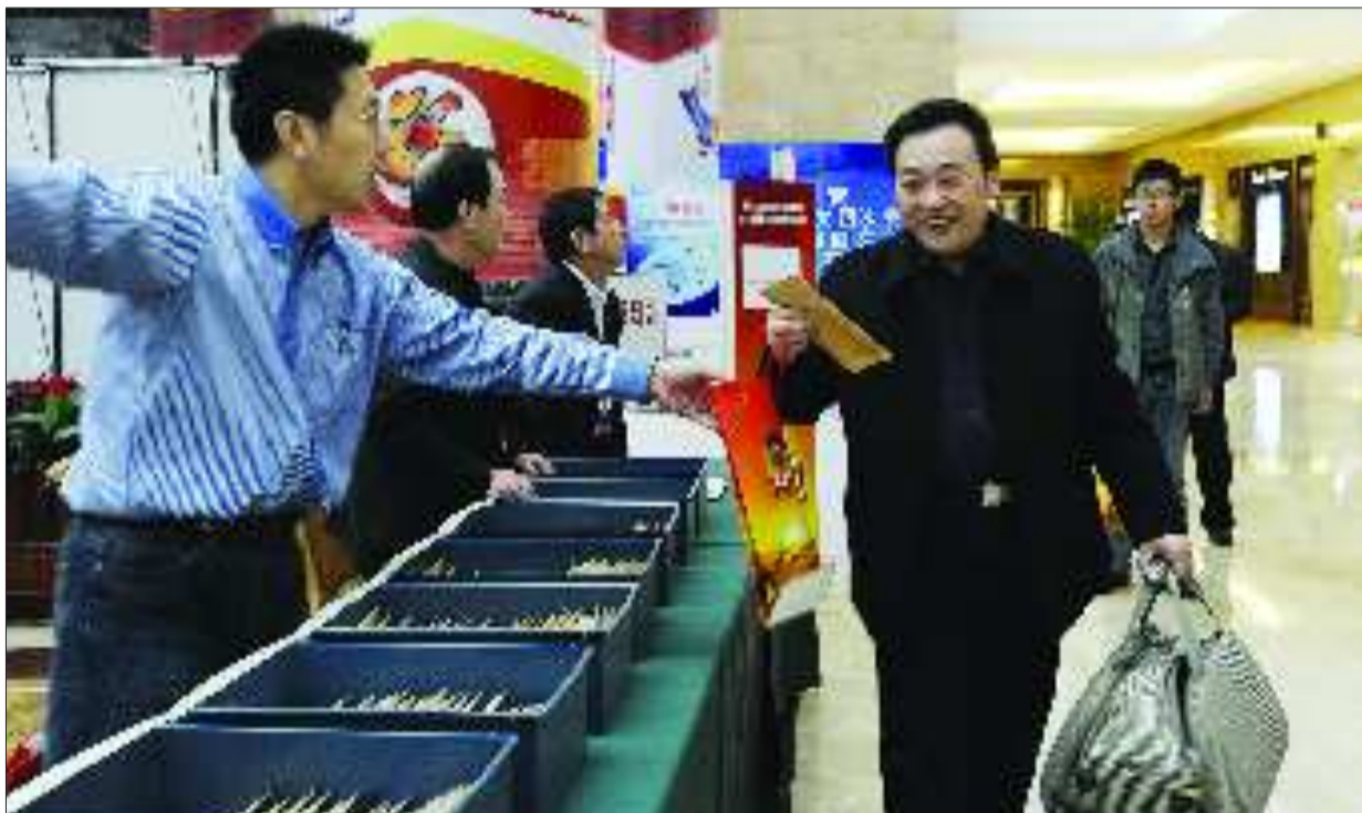
2月10日,在省政协十届四次会议的委员报到处,来自全省各地的政协委员们拿着行李前来报到。