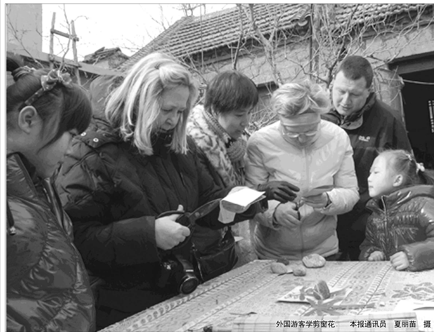
外国游客学剪窗花。

本报泰安2月13日讯(记者 路冉冉 通讯员 张彪 闫晨) 2011年春节黄金周,泰安旅游市场游客人数和旅游收入实现较快、平稳增长。据国家统计局泰安调查队调查数据显示,大年三十至正月初六,泰安市共接待国内游客85.6万人,同比增长27.7%。 据了解,春节黄金周,泰安国内旅游主要呈现以下特点。一是探亲访友特点突出。受传统观念影响,春节长假期间探亲访友、短线旅游居多,探亲访友的游客占游客总人数的13.04%。据对游客住宿方式调查,住在亲友家和自有及亲友第二居所的占到18.85%。二是宗教朝拜游客大增。受祈福传统因素和登泰山保平安的宣传影响,今年春节宗教朝拜游客大增。据对来泰游客问卷调查,宗教朝拜游客占19.57%,位居观光旅游、休闲度假之后,列第三位。三是人均停留天数大幅提高。据调查资料显示,假日期间过夜游客人均停留天数为2.8天,比去年提高了0.54天。泰安通过对住宿设施加强管理监督,加大旅游项目投入等措施,提升了泰安旅游的吸引力和接待能力,游客评价进一步