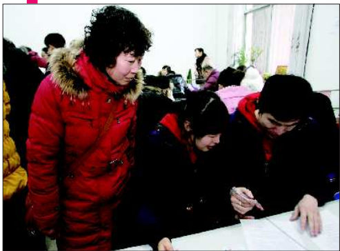
不少家长到登记处为孩子服务。