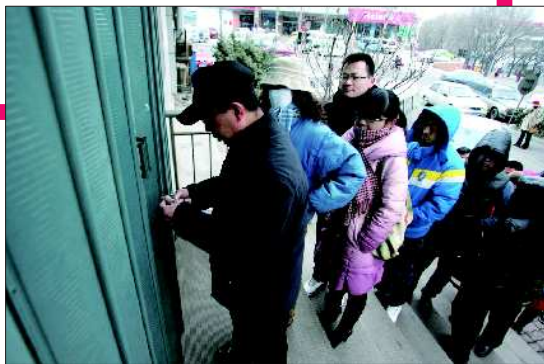
刚过7点,工作人员就打开大门让市民们进入取暖。