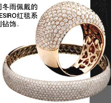
周冬雨佩戴TESIRO蓝色火焰切工克拉钻,与窦骁出席《山楂树之恋》的柏林首映礼。