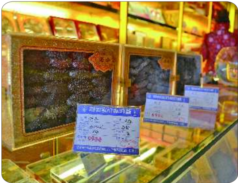
一家海参专卖店里一斤海参售价已经达到近2万元。

一位业内人士还透露,有些不法商贩用劣质海参来冒充优质海参牟取暴利,使得海参的利润空间非常大,一斤1000多元购进能卖到三四千元。有些海参专卖店也存在“看人下单”的现象,对买海参用于送礼的外行顾客,就会狮子大张口,原本每斤卖三四千元的海参就能卖到四五千元甚至更高。