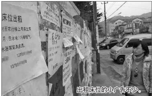
出租床位的小广告不少。

客厅被一张窗帘分割成两部分,一半住人,另一半堆放着行李,甚至厨房里也住着一个人,不足20平米房里挤着3个人……在青大一路的一间租房里,套二的房子里住着6个人。