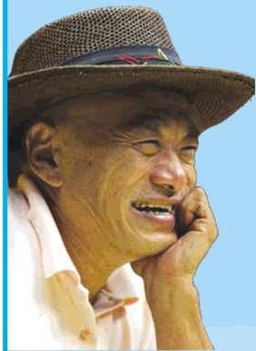
公益形象大使 ——凌峰先生