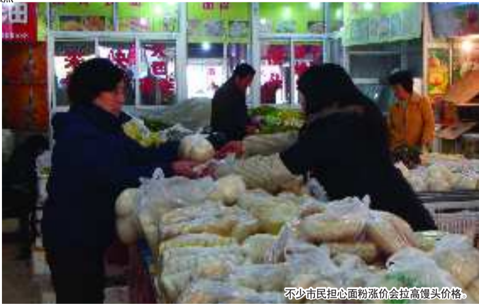
不少市民担心面粉涨价会拉高馒头价格。

21日,记者了解到,目前岛城50斤装面粉每袋上涨2—3元,虽然上涨幅度不大,但不少批发商表示,由于部分面粉厂收购不到足够的小麦,面粉价格近期可能还会上涨。