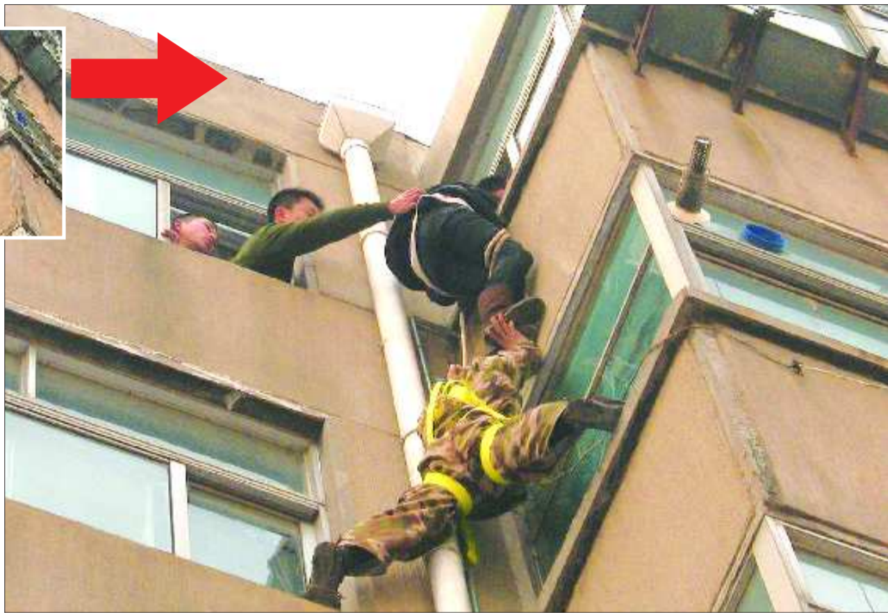
►消防官兵将女子托到6楼,将其救出。

本报泰安2月23日讯(记者 路冉冉 陈新)“有人在5楼阳台上下不来了!”23日上午8点左右,在泰安市一居民小区,一名年轻女子抱着落水管站在5楼阳台外面,上不去下不来。接到群众报警后,泰安市巡特警支队三大队民警、岱庙派出所民警、泰安消防第二中队消防官兵联手将该女子救出。