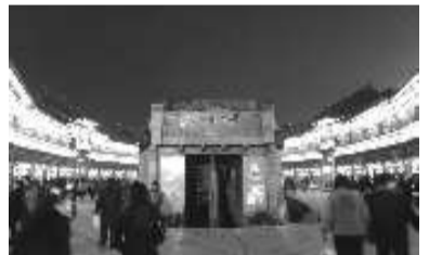
贺年会让枣庄台儿庄古城分外热闹，武术、杂技、布袋戏、杂耍、摆地摊、耍中幡、社火巡游以及乐队、歌舞表演，吸引了全国各地的大量游客前来游玩。