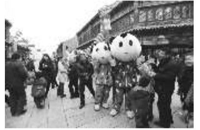
福福乐乐和着表演队伍的音乐节奏欢畅淋漓地表演着各种创意舞蹈，时而逗逗在场的观众，时而搞个高难度的舞蹈动作，显得轻巧而俏皮，让现场的孩子门乐翻了天。