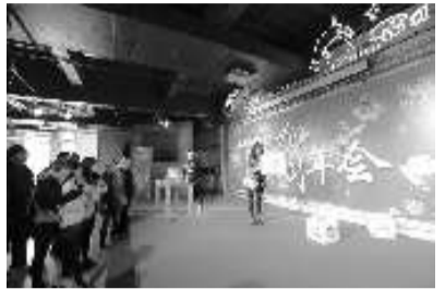
以弘扬山东年俗文化为己任的贺年会讲究把山东的福气、年节的喜气送给前来游玩的人们。抢福游戏为韩国女青年的山东之旅增添了快乐。