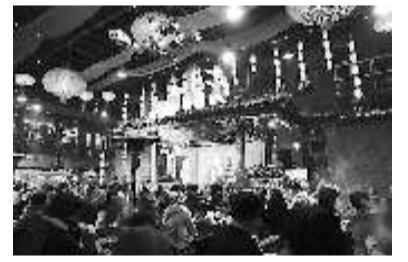
劈柴院是青岛最早的美食城，这里的热闹是出了名的。贺年会期间，全国各地的游客以及众多南来北往的小客商聚集于此，是体验贺年民俗的好去处。