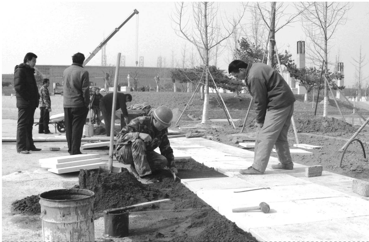
高铁站前广场地面石材铺装正在紧张进行。

本报泰安2月23日讯(记者 李虎) 23日，记者从泰安市京沪高铁泰安站新区工程建设指挥部获悉，总建筑面积13180平方米的高铁广场已经进入了施工冲刺阶段，景观照明、生态水系、景观绿化和地面硬化铺装正在积极进行。预计广场将于5月中旬完成施工，与主站房同时投入使用。