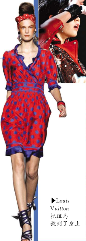
►Louis Vuitton把斑马放到了身上

Jil Sander和Prada把彩色宽条纹推向了时尚前台，之前你根本想不到如此卡通化的条纹能够时髦；强劲的70年代风潮吹来了复古的条纹，作旧效果的条纹衫和短裤将成为年轻一代衣橱的必备品；还有经典的海军、运动条纹，是保证热卖的元素——2011春夏的条纹绝对比以往更多。