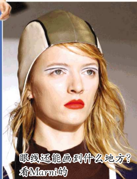
眼线还能画到什么地方？看Marni的