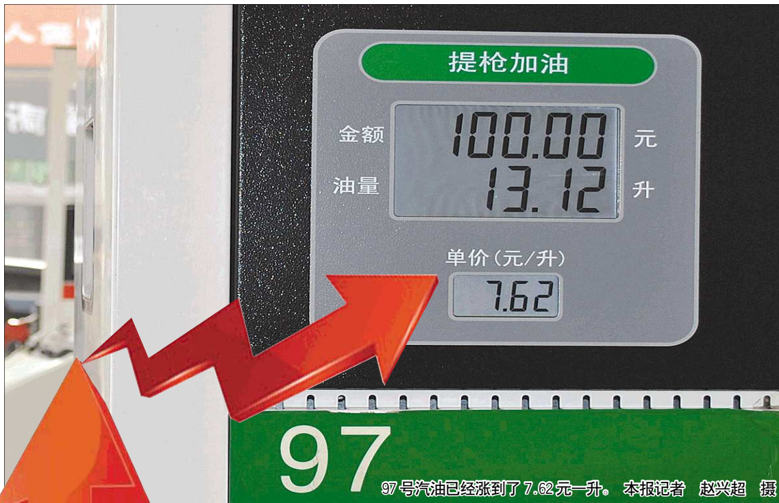
97号汽油已经涨到了7.62元一升。

“汽油和柴油价格都涨了，‘7’时代到来，我每天要少吃一顿早饭才能养得起车啊。”对于此次油价的上调，泰城车主耿先生说出了大批消费者的心里话。面对国际、国内形势，分析师认为油价破“8”很有可能。