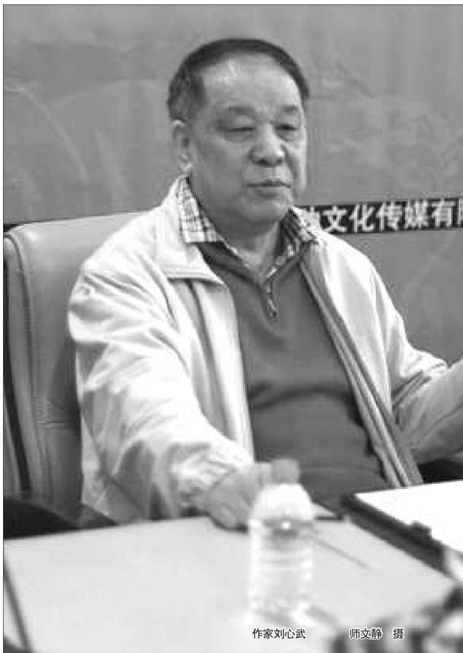
作家刘心武

刘心武表示,续写中对皇权斗争的描述是有的,有人担心他把《红楼梦》写成一部“宫闱秘史”,但事实不是这样。书中写权力斗争只有两回,而且是侧写,通过别人的议论勾勒出的。“我写的还是贾宝玉、林黛玉、薛宝钗、史湘云。”