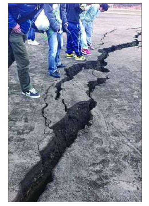
▲宫城县地面出现大裂缝。