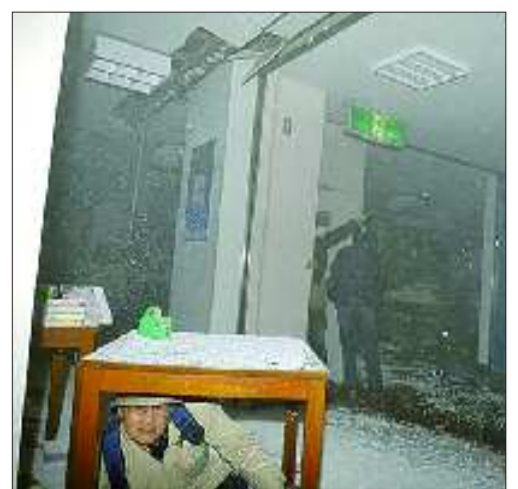
仙台,一名男子在书店的桌子下面躲避地震。