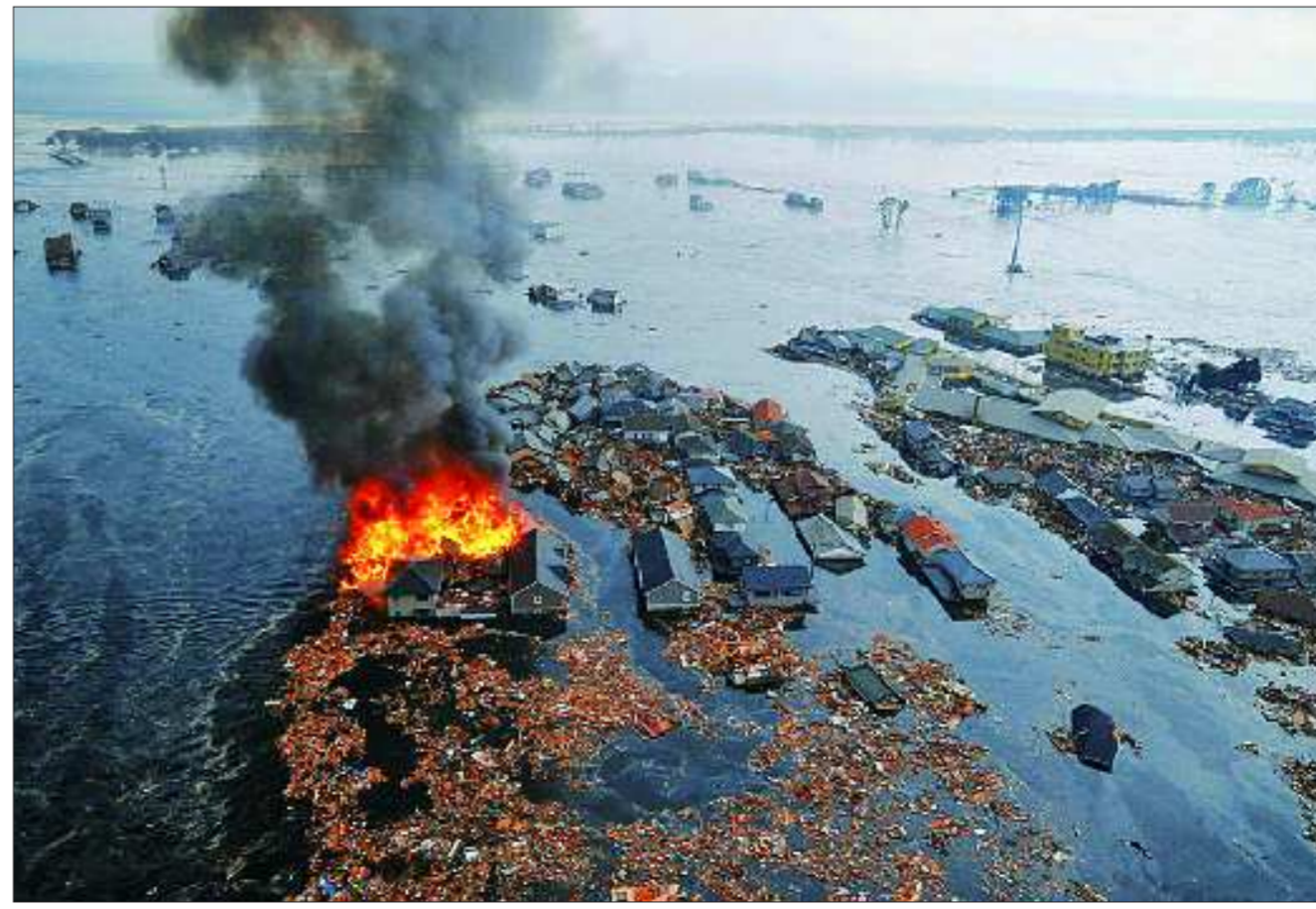
▲在名取市,强烈地震引发的海啸袭击一处居民区。