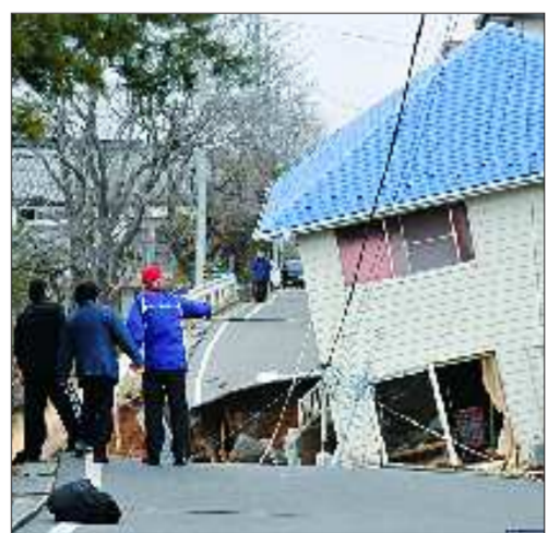
福岛县的须贺川,当地居民查看倒塌的房屋。