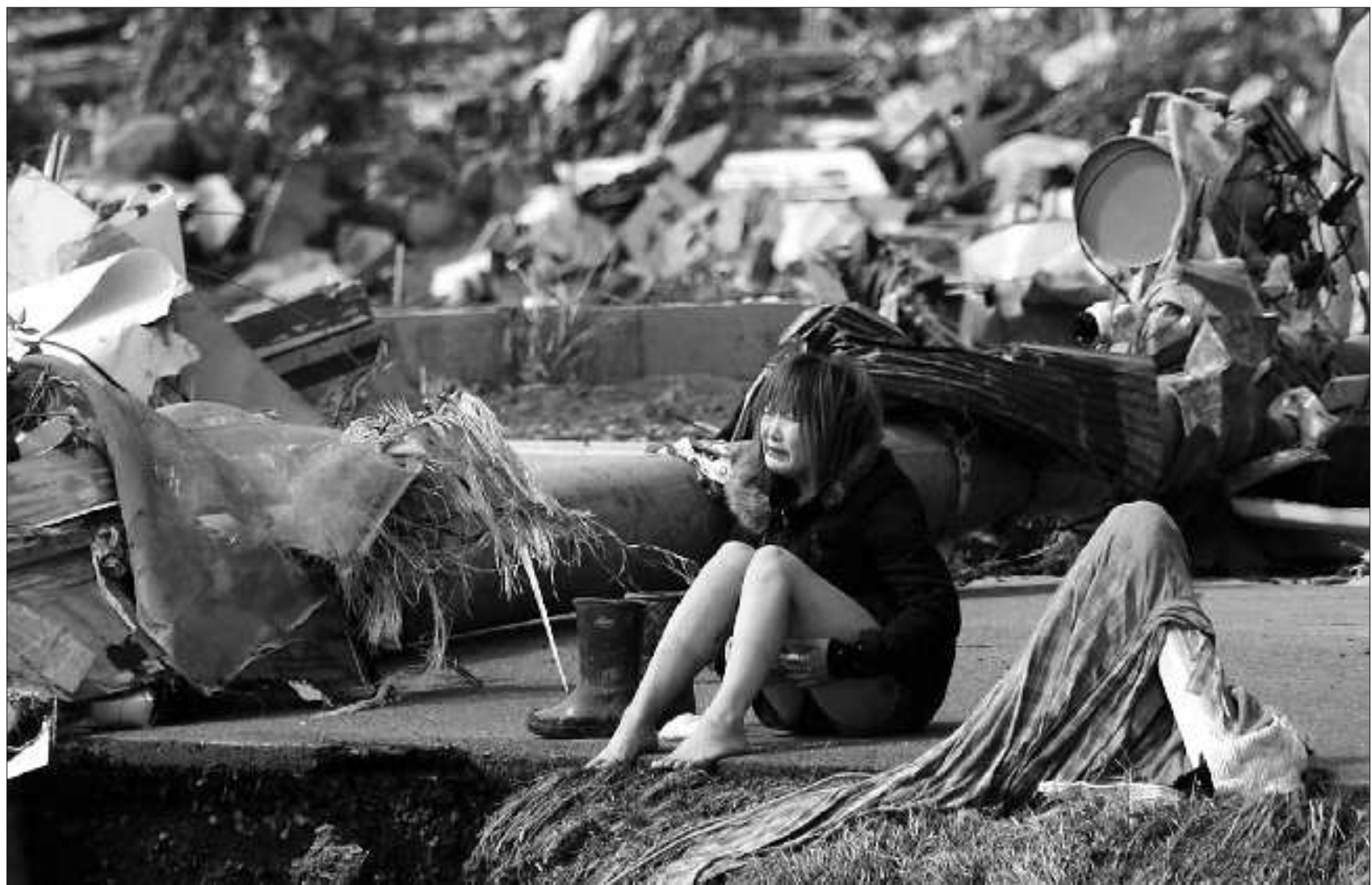
▲3月13日,日本宫城县,一名受灾女子坐在路边大哭。

予各方面救助。丹羽宇一郎表示,日本政府和人民衷心感谢胡锦涛主席等中国领导人向日方表达的深切慰问,对中方连日来向日本派遣救援队,提供救援物资表示诚挚谢意,向通过各种方式向日本人民表达慰问的中国人民表示由衷感谢。