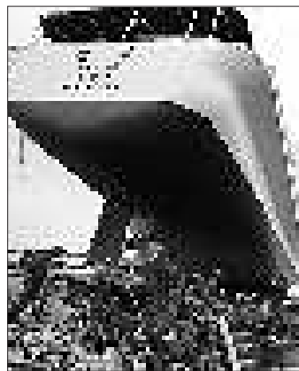
▲3月14日,日本自卫队队员经过一艘被海啸卷起的大船。