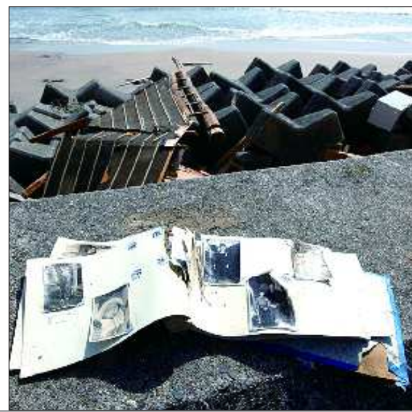
►一张静静“躺”在废墟里的家庭照片，在诉说着昔日的幸福。