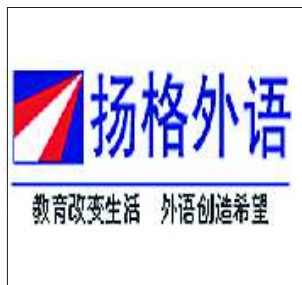
教育改变生活 外语创造希望