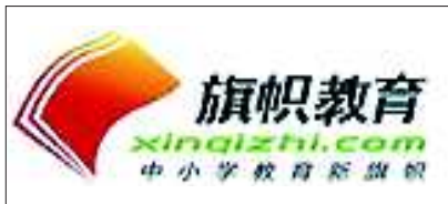
中小学教育新旗帜