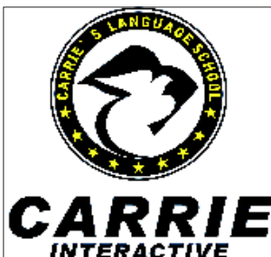
凯瑞互动外语学校