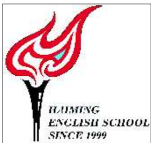
海铭外语培训学校