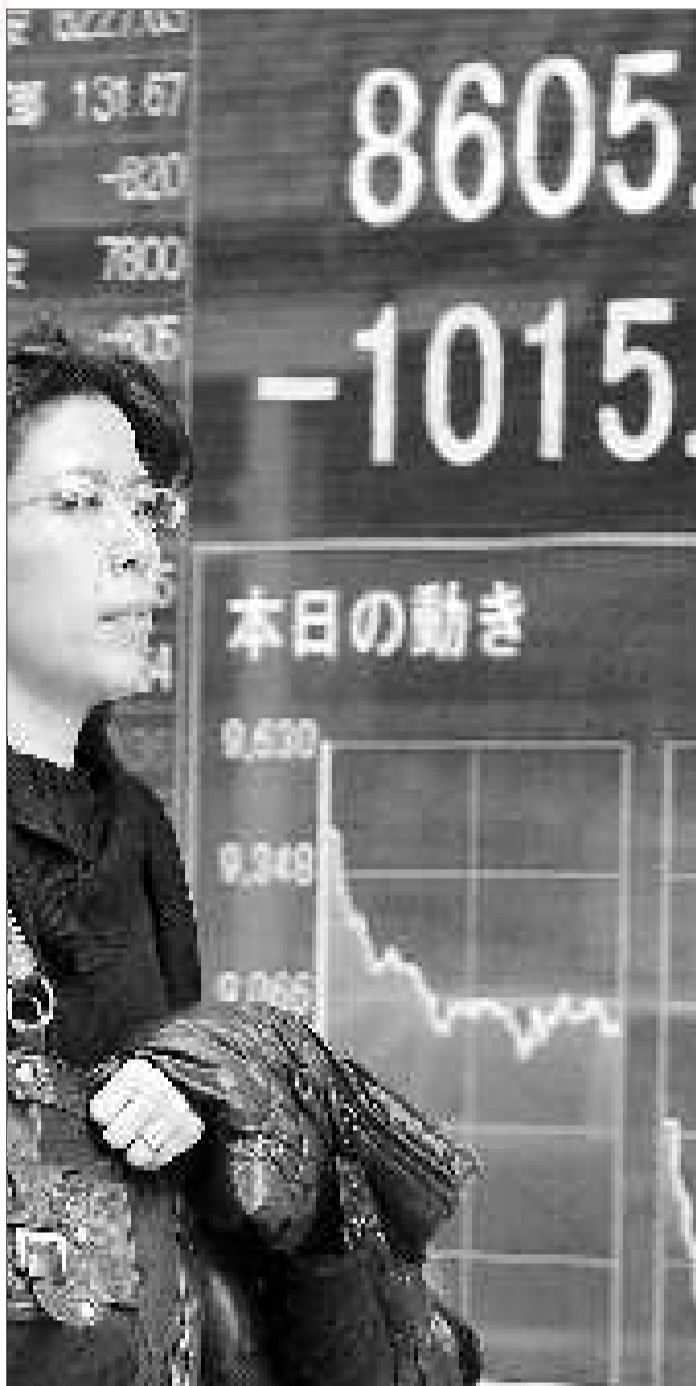
3月15日,在日本东京,行人经过电子股价显示屏。东京股市日经股指暴跌10.5%

波音787型“梦想”客机35%的零部件由日本厂商生产,包括机翼和主起落架等重要零部件。波音发言人汤姆·布拉班特说,波音供应商多位于东京以南,地震“尚未对工厂区域产生重大影响”。