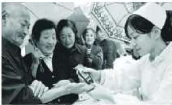
首批断药患者在化糖门诊检测血糖

化解血糖不吃药 北京医院的临床数据 通过吃饭获得的血糖可以及时地转化为能量，所以健康人没有降糖机能，只有化糖本能，而传统的口服药、保健品是把血糖当垃圾扔掉，病人身体没了能量，体力必然越来越差，并发症越来越多，最后致残或死亡。