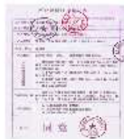
国家有关部门特别批示：化糖贴适用于常规治疗效果不理想的II型糖尿病患者，铁证如山。