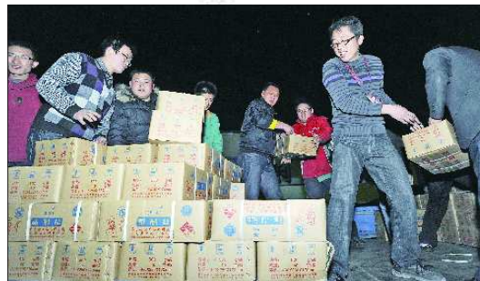
▲17日晚,济南盐业公司仓库内,工作人员正在配送食盐。当日他们向济南30多家大型超市送盐约170吨。