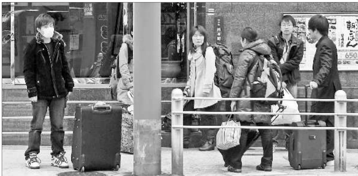
3月15日,丛中笑第一次见到他们就是在大阪街头流浪。

“保命法则”中还包括知道使用紧急危害留言专线,确认灾区情报,在灾难留言板留言、拨打危急时刻求救电话等保命办法。