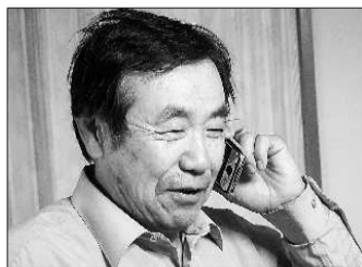
西田先生接到中国留学生父母打来的感谢电话。