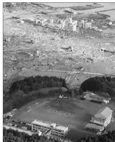
南三陆町几乎被夷为平地,但学校却依然坚固,图为震后人们在学校操场上打出大大的SOS字样等待救援。

目前大阪人购房,首先参照的就是建筑物的防震等级,越高的高层住宅,因为建筑标准较高,预防地震灾难的能力强,售价昂贵。而一些早年的旧建筑,由于防震水平较低,在二手房市场上卖得很便宜也少人问津。