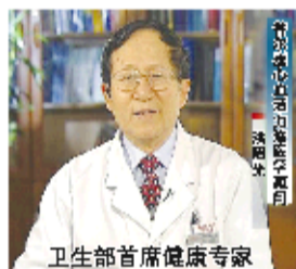
卫生部首席健康专家

医学专家组分析报告表明:传统心脑血管药物80%以上含扩张成分,其治疗方法能使血管短时间内急速扩张,造成心脑血管缺血缺氧,但并没有起到防治作用,反而危害极大,主要体现在以下几个方面: