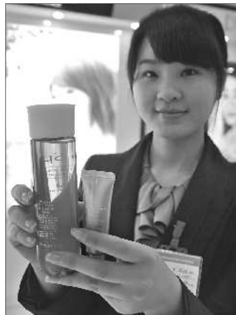
导购员展示一款日本品牌化妆品。