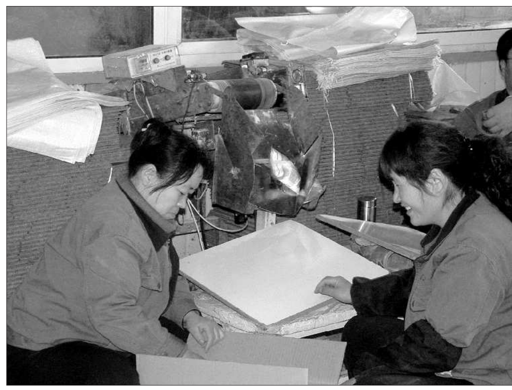
工人正在加班加点生产食盐。

本报3月17日讯(记者 郝文杰) 17日,记者从东营市广饶县明华食盐厂获悉,该厂开足马力生产食盐,日供应食盐可达80吨,为平常供应量的4.6倍。食盐供应充足。广饶明华食盐厂宋维亭介绍,盐厂正在加班加点加工食盐,日加工生产能力80吨,为平常供应量的4.6倍,并将投放到东营市场,“咱们