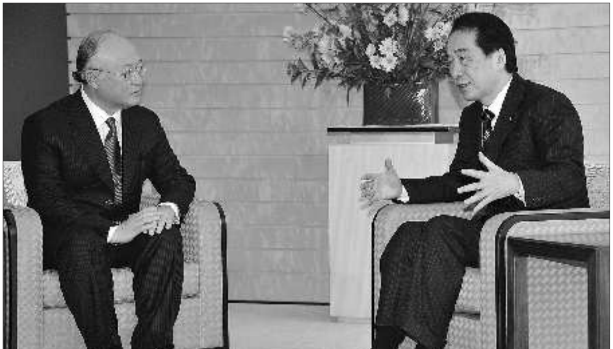
3月18日,国际原子能机构总干事天野之弥(左)等一行人员抵达日本东京,与日本首相菅直人举行会晤,就日本震后救灾、福岛核电站危机等事宜进行商议。