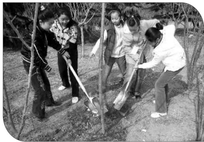
我们是植树女生组 看我们的

3月12日是全民义务植树节,本报50余名小记者来到滨河景区参加了义务植树活动。小记者们在现场干劲十足地植下了承载着自己希望的小树苗,为滨河景区增加了一道亮丽的风景线。