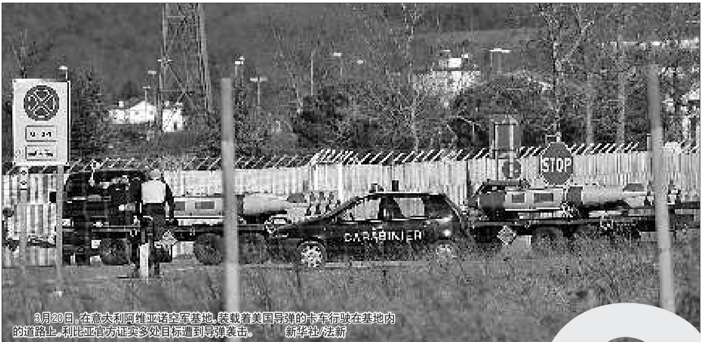
3月20日,在意大利阿维亚诺空军基地,装载着美国导弹的卡车行驶在基地内的道路上。利比亚官方证实多处目标遭到导弹袭击。

2008年9月,美国国务卿赖斯访问利比亚,这次访问是在两国长时间对抗之后,美国国务卿首次访问利比亚,也是赖斯首次出访一个曾被美国贴上“无赖国家”标签的国家。综合新华社等