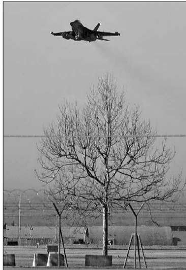
20日,美国空军的一架F18战机从意大利阿维亚诺空军基地起飞。