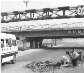
▲保洁人员在清扫污染的路面

本报3月20日热线消息 (通讯员 景平 春军 记者 孟凯)3月18日,滨河城管二中队执法人员巡查至南坊北大桥时,发现桥下滨河路限高栏下有成堆渣土,不仅破坏了市容,还影响了交通,带来很大的安全隐患。