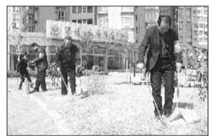
▲小区志愿者正在清扫小区内的垃圾。

本报3月21日讯(记者吴慧)“创城我也出力!”近日,在水岸华庭社区内,一批由社区居民自发组建的创城志愿者频繁活跃在小区里的每个角落。