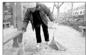
▲环卫工人正在对健身长廊进行清扫。

本报3月21日讯(记者廖杰)21日,有市民向记者反映,位于市区开阳路与羲之路交会处东南角的一处休闲长廊,被各式各样的食品塑料袋、饭菜泔水、纸屑等垃圾包围,现场一片狼藉。