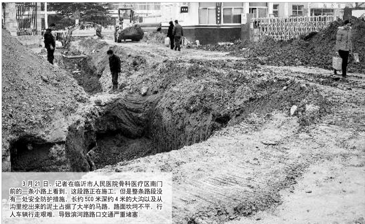
3月21日,记者在临沂市人民医院骨科医疗区南门前的一条小路上看到,这段路正在施工,但是整条路段没有一处安全防护措施,长约500米深约4米的大沟以及从沟里挖出来的泥土占据了大半的马路,路面坎坷不平,行人车辆行走艰难,导致滨河路路口交通严重堵塞。