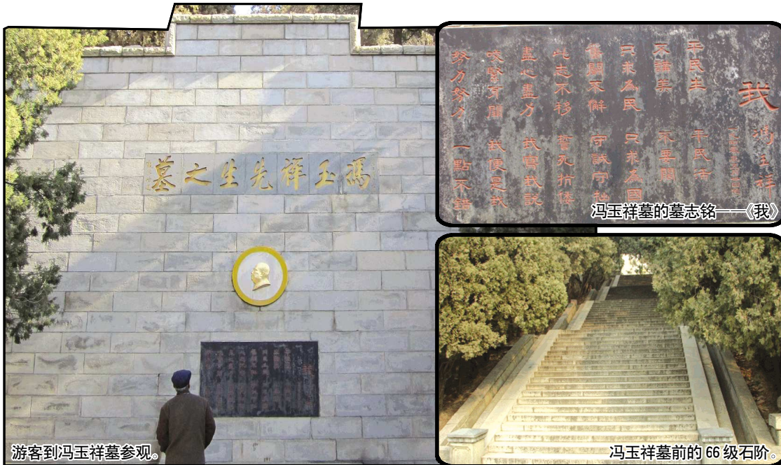
游客到冯玉祥墓参观。