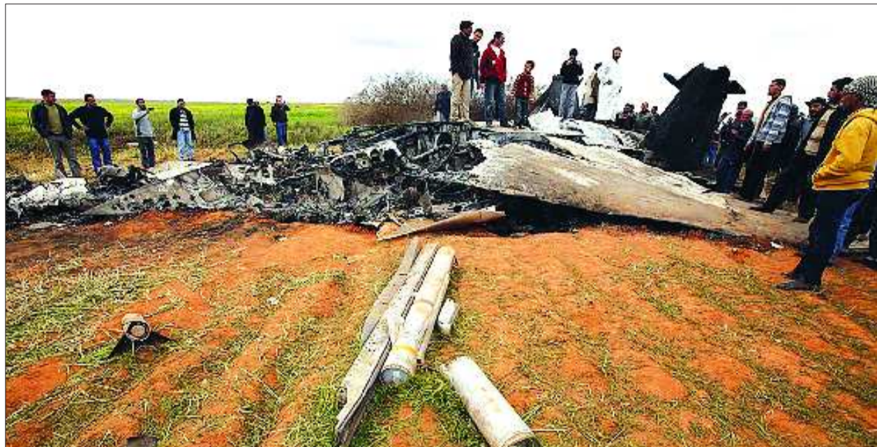
3月22日,美国军方一名发言人称,美军一架F-15E“鹰”式战斗机因机械故障在利比亚坠毁。图为坠毁的美军F-15E战斗机残骸。

卡梅伦当天在议会下院就对利军事行动举行的辩论会上说,英国皇家空军的“台风”战斗机已经飞往意大利南部的基地,它们将参与对利比亚禁飞区的巡逻行动。卡梅伦还宣布,美国将把此次军事行动的领导权交给北约。