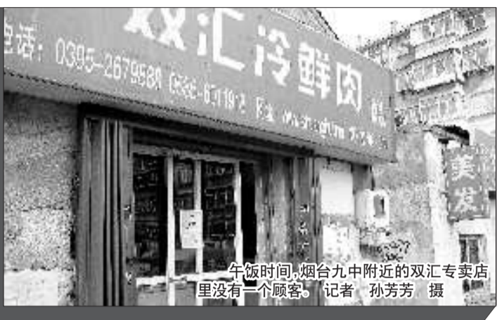
午饭时间, 烟台九中附近的双汇专卖店, 里没有一个顾客。

“瘦肉精”事件被媒体曝光后, 烟台部分超市已将双汇肉食统统下架, 虽然来自我省德州的双汇冷鲜肉仍在销售, 但经营者都遇到了顾客锐减, 销量骤减的情况。