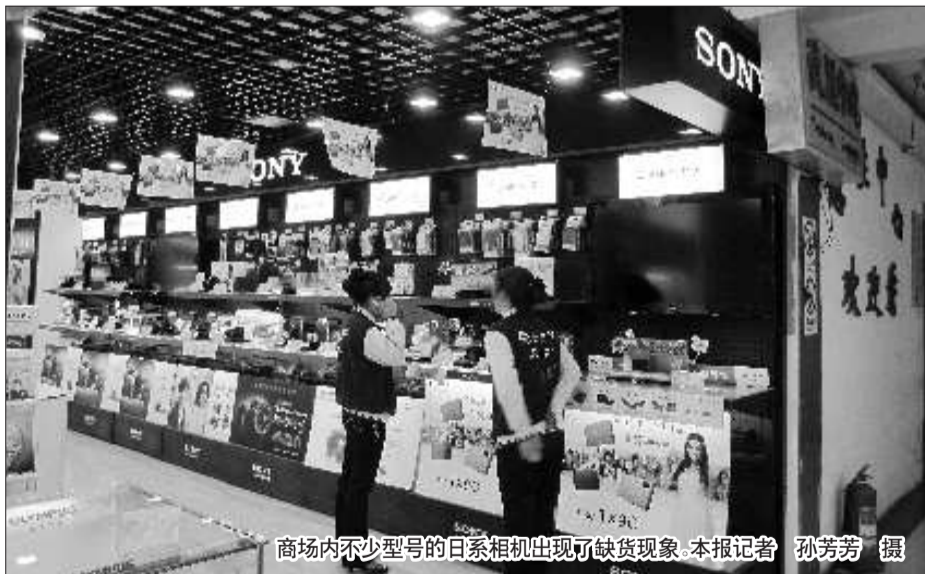
商场内不少型号的日系相机出现了缺货现象。

日本发生9.0级大地震后, 不少市民发现, 以日系品牌为主的数码相机在港城已悄然涨价。22日记者了解到, 索尼、尼康、佳能等日系相机近期出现了500元到1000元不等的涨幅, 有的机型由于缺货即使有钱也买不到了。