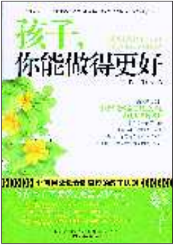
◆书名:《孩子,你能做得更好》 ◆作者:王晖 郭冬贵 ◆出版社:春风文艺出版社

方策的舅妈至今还记得方策小时候搞出的类似“恶作剧”的小把戏。一次,方策在姥姥家发现了姥爷的一个印泥盒,觉得用印泥在屋里的墙壁上一定能印出很好看的图案,就指挥自己的小表妹往墙上按手印。一会儿,姥爷回来了,看到墙上被人画上了一道道的红印儿,就去责问孩子们“谁画的”,方策摊开自己的两只小手告诉姥爷不是她画的,于是,小表妹被大人狠狠地批评了一顿。